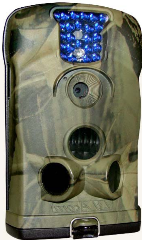
Caméra détecteur de mouvements